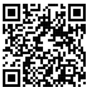
QR kódy pre video návod